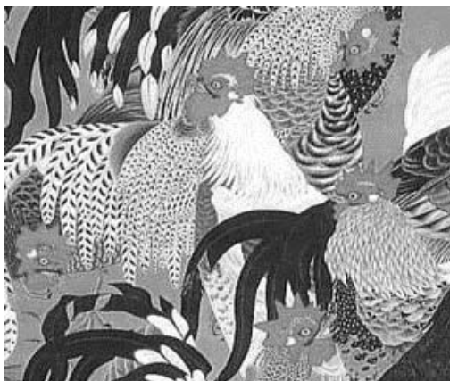
図1 動植綵絵（群鶏図）

江戸時代の絵画文化は17世紀の京都・18世紀の京都・19世紀の江戸と、栄えた時期と場所により前期・中期・後期に区分される。そして前期に元禄文化の時代が、後期に化政文化の時代が含まれる。中期は中国の南画が京都にもたらされたこと、寺社にある美術資産を手本に利用できたことで、京都で絵画文化が大きく発展し、そこに若沖は存在した（西田, 2007, p.4）。