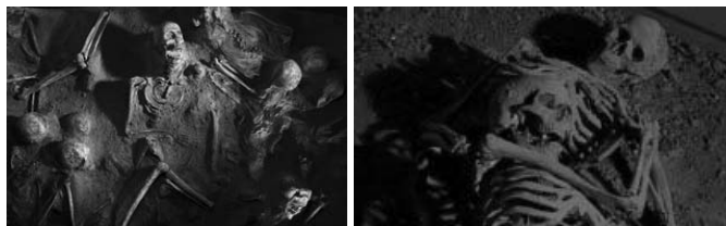
船着場の中に残った遺骨

また、ポンペイでは人々の身体は燃えなかったのに、ヘルクラネウムの遺体は骨しか残らなかったのは、火砕流などのガスに襲われた状況に違いがあったからである。ヴェスヴィオ火山との距離がポンペイは10kmなのに対し、ヘルクラネウムとの距離はわずか5kmである。噴火で逃げまどうヘルクラネウムの人々に、ポンペイよりも早く、摂氏500℃のガスが午前1時に時速100kmで襲いかかった。一瞬にして肉体は焼かれ、骨だけが残った。ヘルクラネウムは火口から5kmであるゆえ、500℃の火砕サージがわずか3分で到達した。それに対し、ポンペイは10km離れているため、到達するまでに300℃まで温度が下がったのである。