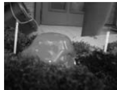
粘り気が弱いもの