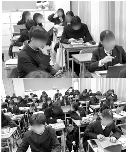
ペアワークのようす