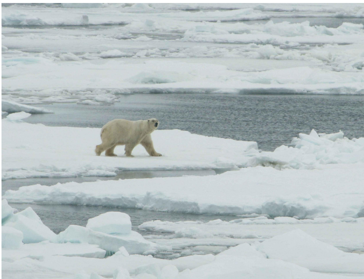
(氷が溶けてしまい住処が減少してしまっているホッキョクグマ)

近年北極では、地球温暖化に伴う海水温の上昇が原因で、海水が蒸発し、海水の塩分濃度が高くなったことで、海氷が脆くなっているため、北極で暮らす生き物たちのすみかが失われていっていることが問題視されている。そこで、海水の濃度と形成される海氷の強度の関係を明らかにしたいと考えた。