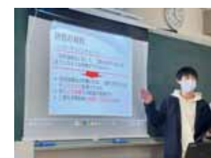
スライド発表の様子