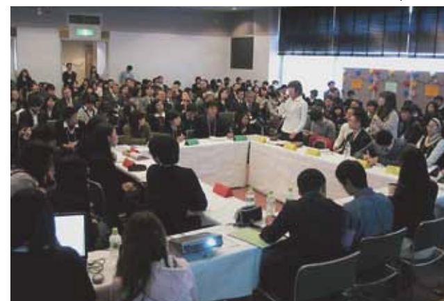
ESD国際ワークショップ

本校は、2003年度にユネスコスクール (ASPnet: Associated Schools Project network) へ加盟しました。そして、大阪を中心とした約20校のASPnet校で、共に学び合う場に参加しています。世界の加盟校との「学び合い」「協働研究」を日本で先駆けて開始しました。お互いに育ってきた背景や文化の違いがあるからこそ「人としての普遍」を学ぶことができます。2012年1月にはUNESCO Bangkok Officeの呼びかけによって行われた「日本応援・連帯メッセージ」に参加し、生徒が作詞・作曲した歌「絆」がメッセージとして被災地東北のASPnet校に届けられました。また、2014年に岡山で開かれた世界32か国によるユネスコスクール世界大会高校生フォーラムでも、企画運営で本校生が活躍しました。