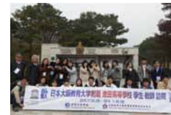
韓国・サンダン高校との交流

2021年度のサンダン高校とのオンライン交流では、事前交流として自己紹介動画の作成やプレゼント交換を行いました。交流当日は「平和の文化創造のための小さな一歩」をテーマに、英語でお互いの未来を考え交流し合い親睦を深めました。最終日には「真の理解へ向けた私たちの提案」について話し合い、共同宣言を作成しました。