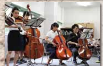
弦楽アンサンブル部