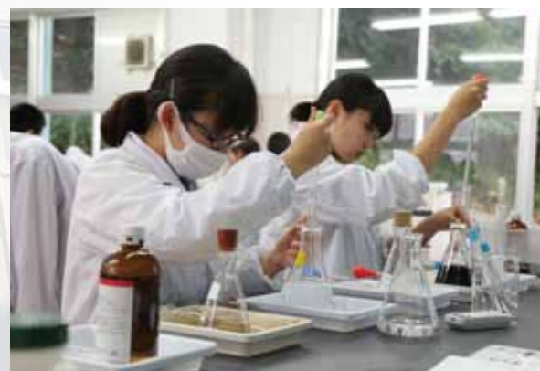
実験を重視した学び（化学）