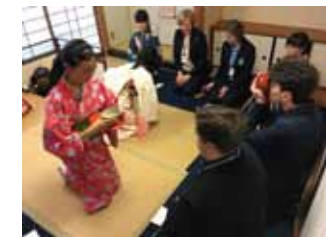
リトアニア・ジャミナ高校との交流