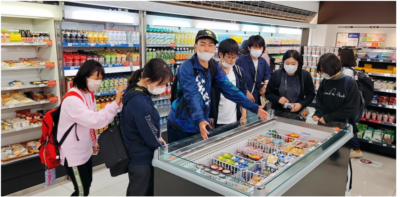
デザートも食べるよ～