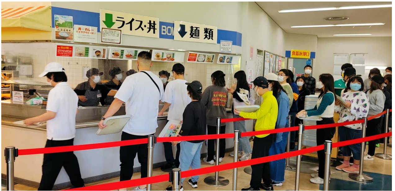
カウンタの前には長蛇の列が…