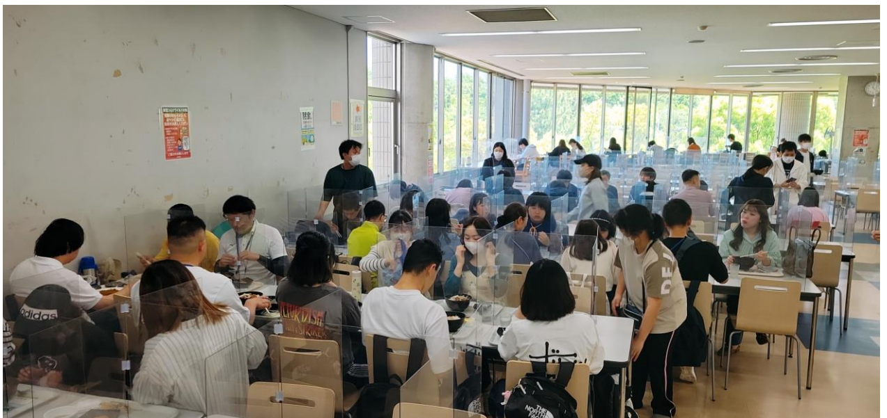
それぞれが自分の食べたいメニューやお惣菜を選んで、美味しくいただきました。ほとんどの生徒の食べる量が大学生よりも多いのに驚きました。若さの力ですね。