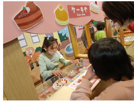
小学部3組 梅田方面