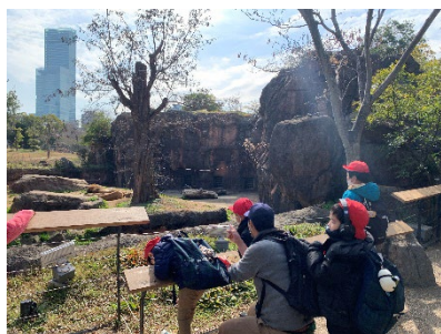
小学部1組 天王寺動物園

各学部いろいろな場所へ校外学習に出かけました。小学部は2月17日に1組が天王寺動物園、2組がキッズプラザ大阪、3組が梅田方面に行きました。中学部は2月10日に堺浜えんため館でボウリングをしました。高等部は3年生が NHK BK プラザとル・クロ・ド・マリアージュでテーブルマナーの学びながら食事をしました。高等部1年生と2年生は3月1日に出かける予定です(1年生 セブンパーク天美・VS パーク、2年生 こんぺいとうミュージアム)。