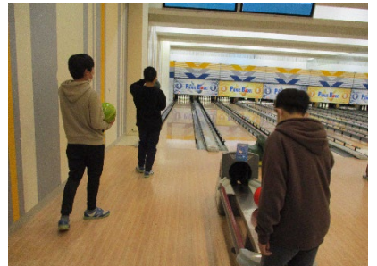
高等部 NHK BK プラザ ル・クロ・ド・マリアージュ