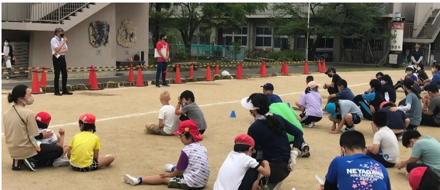
本校防犯避難訓練の様子と附属池田小に建立された 「祈りと誓いの塔」

本校では5月30日に防犯避難訓練を行い、校長から事件の話を行いました。また、6月8日の10時に一斉放送で事件の話をした後、校内全員で黙とうを行いました。