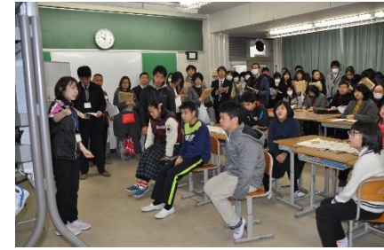
中学部 くらし(社会)