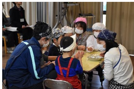
小学部 クラスせいかつ