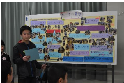
中学部 交流及び共同学習