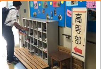
■高等部は靴箱を高等部教室側に移動しました。