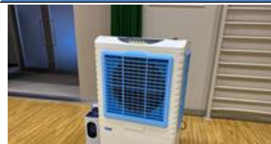
■体育館に換気と熱中症対策で「冷風扇」を購入し対策を講じました。