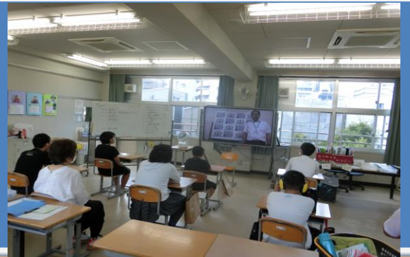
■始業式 校長先生がVTRメッセージで児童生徒に向けてメッセージを發しました。

二学期が8月24日から開始しました。始業式は、一学期の終業式同様に校長室からのビデオメッセージで行いました。生徒からは後で「テレビに映っていた校長先生や!」と言ってくれました。普段とは違う様相が子どもたちの中にも定着しつつあります。さて、二学期ですが、新型コロナウイルス対策もあります。まだまだ暑い中の「熱中症対策」も重要な視点です。子どもたちにとって楽しみな学校生活になるよう感染防止や熱中症対策を講じて学習活動や運動・遊び活動など徐々に普段の学校生活を取り戻していきたいものです。