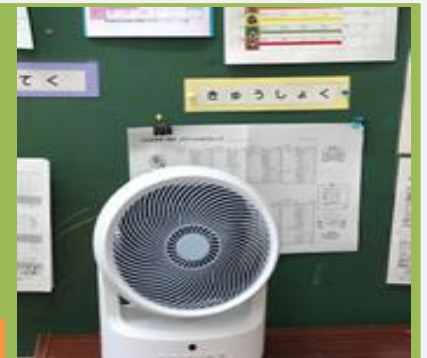
■各教室にサーキュレーターを設置しました。