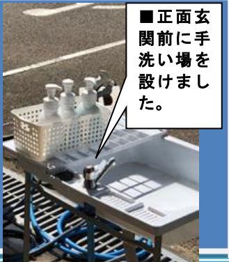
■正面玄関前に手洗い場を設けました。