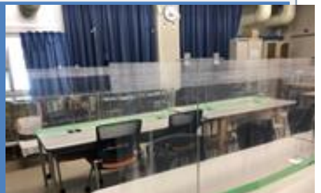
■机の真ん中に「シールド」を設置して感染防止をしています。

★今回の新型コロナウイルス感染防止に向けて、校内の環境整備に着手しました。「3密」防止のための「導線」の確保や各種機材の購入、消毒の徹底などに取り組んでいます。