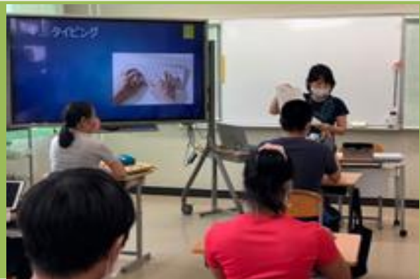
■実習生の高等部生徒への授業 パソコンに文字入力するためのタイピングを学びました。