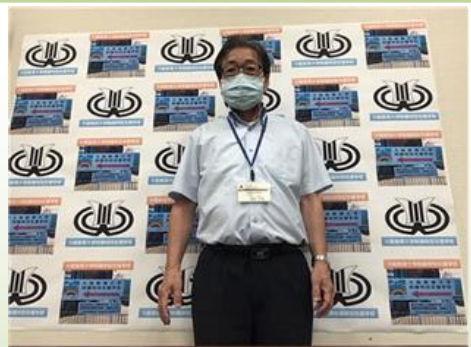
■今回は校長室からの始業式ですが、テレビでよく見かける背景をまねて附属特支の「校章」と長居公園通道横の「相談・支援センターの看板」を壁紙にしてみました。

二学期が8月24日から開始しました。始業式は、一学期の終業式同様に校長室からのビデオメッセージで行いました。生徒からは後で「テレビに映っていた校長先生や!」と言ってくれました。普段とは違う様相が子どもたちの中にも定着しつつあります。さて、二学期ですが、新型コロナウイルス対策もあります。まだまだ暑い中の「熱中症対策」も重要な視点です。子どもたちにとって楽しみな学校生活になるよう感染防止や熱中症対策を講じて学習活動や運動・遊び活動など徐々に普段の学校生活を取り戻していきたいものです。