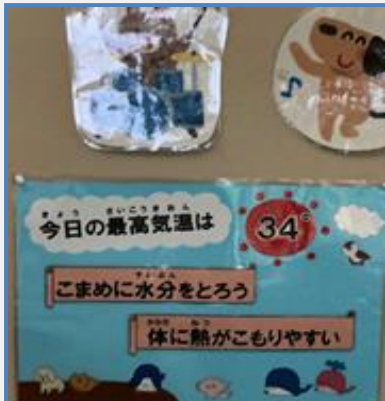
■保健室前の熱中症対策