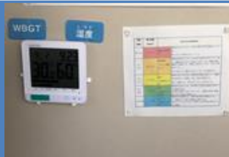
■保健室前には新型コロナウイルス感染防止のための消毒液と熱中症予防の張り紙・温度計・湿度計があります。