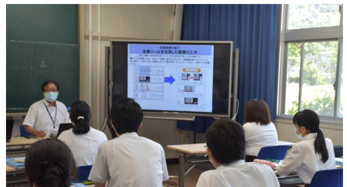
■実習オリエンテーションで校長から「教育実習臨むにあたって」を講話しました。